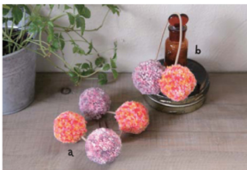
ポンポンを4つ繋げて存在感抜群のシュシュ、2つ使えばヘアゴムに。さっと無造作にまとめた髪に結んで、腕やバッグにつけても可愛いです。