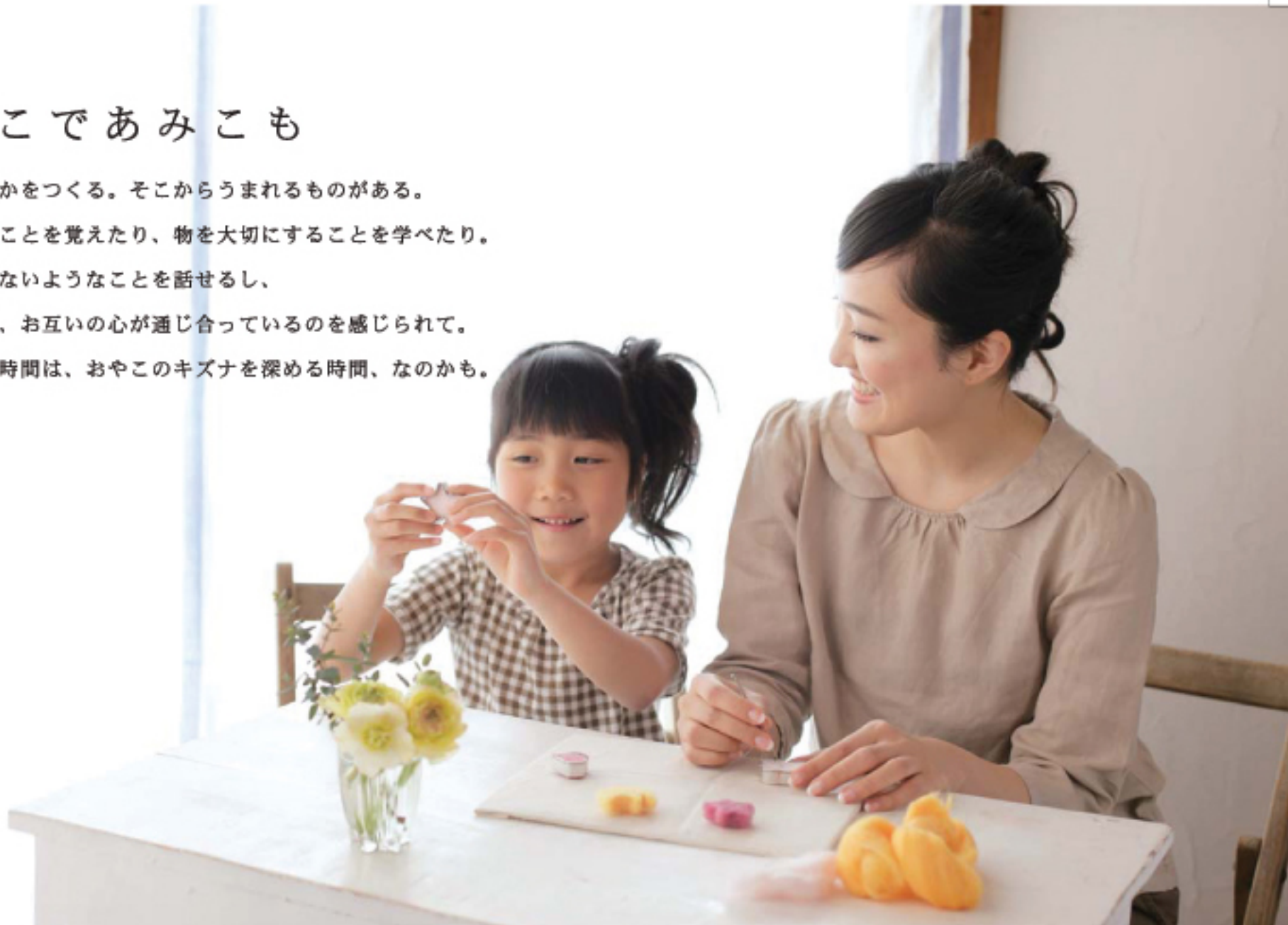
※針をご使用になる際、怪我には十分にお気を付けください。特にお子様のご使用には注意が必要です。

一緒になにかをつくる。そこからうまれるものがある。 工夫をすることを覚えたり、物を大切にすることを学べたり。 ふだん語らないようなことを話せるし、 なんとなく、お互いの心が通じ合っているのを感じられて。 手づくりの時間は、おやこのキズナを深める時間、なのかも。